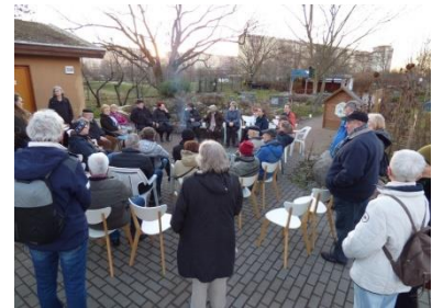
Treffen im Garten der Begegnung