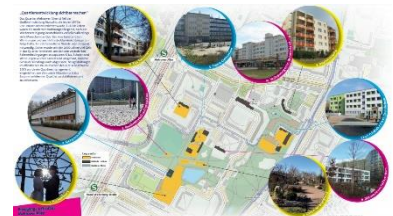
Flyer „Quartiersentwicklung sichtbar machen“ (Gestaltung: stadt.menschen.berlin)