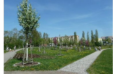
Hochzeitspark Marzahn